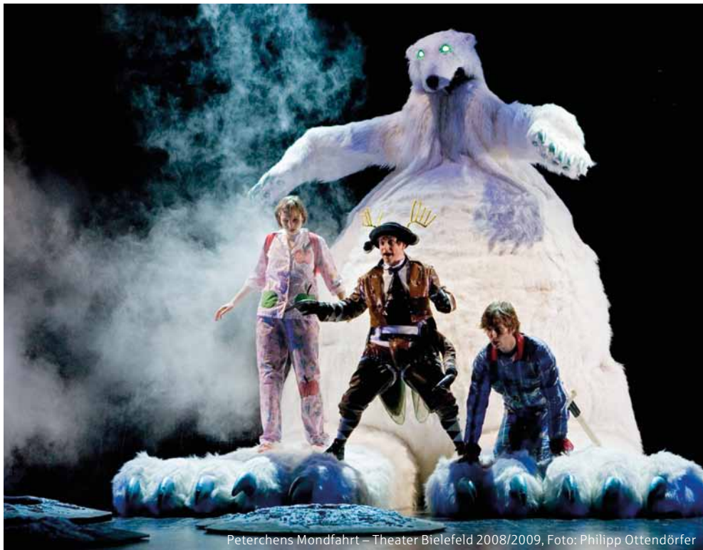
Peterchens Mondfahrt – Theater Bielefeld 2008/2009, Foto: Philipp Ottendörfer